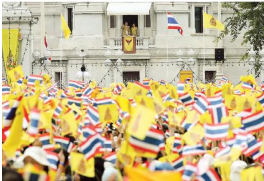
การรวมตัวกันอย่างเป็นทางการเป็นปีกแผ่นของคนไทยบริเวณหน้าพระบรมมหาราชวัง

กำลังใจเป็นสิ่งที่มีความสำคัญยิ่ง ไม่เว้นแต่เจ้าฟ้าเจ้าแผ่นดินต่างก็มีความต้องการวิกฤติ (Critical Requirement :CR) เช่นกัน ด้วยเหตุนี้ สถาบันหลักของชาติทุกระดับ โดยเฉพาะสถาบันการศึกษาในระดับชุมชน อันได้แก่ ศาสนา โรงเรียน และครอบครัว จึงต้องเข้าใจบทบาทหน้าที่อันเปรียบเสมือนครอบครัวแก้วคุ้มภัยให้กับคนในสังคม สถาบันครอบครัวก็มีส่วนสำคัญลำดับแรกในการถ่ายทอดแนวคิดให้กับสมาชิกในครอบครัว ซึ่งเป็นจุดเริ่มต้นที่สำคัญสุด พ่อ แม่ และครูบาอาจารย์จึงเป็นกลไกสำคัญในการขับเคลื่อนการอยู่ร่วมกันในสังคมให้ไปข้างหน้าด้วยกัน โดยแต่ละองค์ประกอบรวมกันเป็นสังคมไทยจะขาดส่วนใดไปไม่ได้ เพราะครอบครัว ชาติ ศาสน์ กษัตริย์ เราอยู่ร่วมกันเป็นสังคมวัฒนธรรมไทย ซึ่งประเทศไทยเป็นหนึ่งในไม่กี่ประเทศที่ยังคงปกครองด้วยระบอบประชาธิปไตยอันมีพระมหากษัตริย์ทรงเป็นประมุข อีกทั้งยังรักษาเอกลักษณ์ความเป็นชาติไทยไว้ได้อย่างน่าภาคภูมิใจ และเชื่อมั่นว่าประเทศไทยจะพัฒนาได้อีกไกล หากมีความเฉลียวฉลาดในการนำพลังของสถาบันหลักมาใช้เป็นแรงหนุนในการพัฒนาประเทศต่อไป (เอนก เหล่าธรรมทัศน์, ๒๕๖๓)